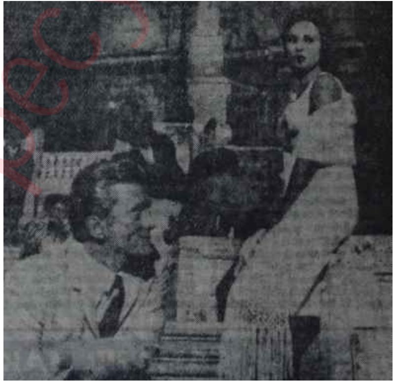
Douglas ve Lavi "Romada İki Hafta"da Günah çıkarıcılar

dert anlatmak, bambaşka telden çalan italyan yapımcıyla uğraşmak vardır. Minnelli, bu yabancı çevreye bir Hollywood oyuncusu olan Jack Andrus'u getirmektedir. "Çıplak Ruhlar"da yoluna çıkan engelleri temizlemek için merhametsizce davranan yapımcıyı canlandıran Kirk Douglas, on yıl sonraki filmde bir Hollywood oyuncusunun başına gelebilecek başlıca belâların hepsine uğramış olan Andrus'u canlandırmaktadır: Andrus gözden düşmüştür, boşanmıştır, otomobil kazası geçirmiştir -belki de kaza değil, intihar teşebbüsü-, alkoliktir. Eski ünlü günlerinde filmlerini yöneten Kruger (Edgard G. Robinson), bu oyuncu ve insan kalıntısını, filmde çalışmak üzere Romaya çağırır. Andrus, tedavi edildiği akıl hastahanesinden ayrılıp, film çevirmeğe gider. Romaya varır varmaz yabancı ve düşman bir çevreyle karşılaşır. Üstelik, mahvına yol açan eski eşinin -Cyd Charrisse- ortaya çıkışı işleri büsbütün karıştırır. Kruger de ayrı bir derttir, eski gücünü kaybettiği ölçüde büyüklük deliliği artan bir yönetmen olarak ortaya çıkmıştır. Kaprisli, budala bir italyan film yıldızı -Rossano Schiaffino-, "âsi genç" tipindeki jön -George Ha-