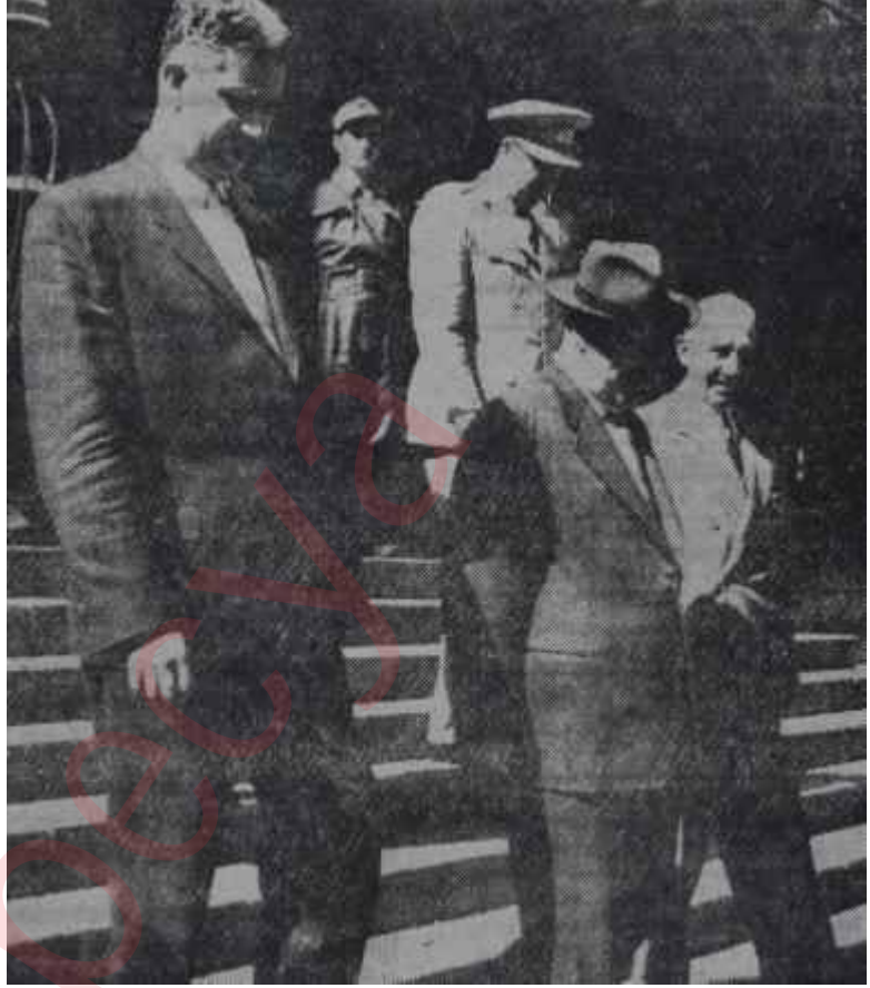
Cemal Gürsel Başkanlık önünde Mazi olan mutlu günler

dan doğrulandı. Bir mucize olsa ve Cemal Gürsel yaşasa dahi artık Cumhurbaşkanlığı gibi bir görevi ifa etmesine imkân ve ihtimal kalmamıştır.