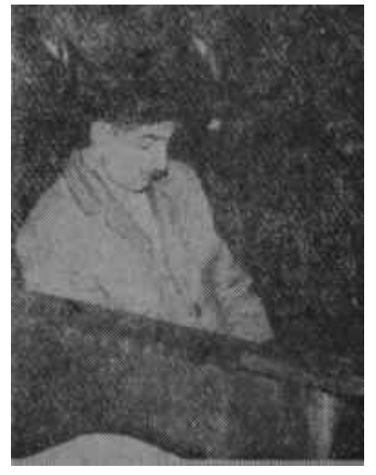
Abdi İpekçi — Ö. Sami Coşar Araştırmacılar

leri ve nihayet 13 Kasım'da ilk Komitenin tasfiye edilmesini ve "14'ler" in yurt dışına gönderilişini anlatmaktadır. İki usta gazetecinin elbirliğiyle, bir röportaj havası içinde ve senaryo tekniğiyle yazılmış olan eser son derece kolay okunmaktadır. İkinci cildinde 22 Şubat ve 21 Mayıs olaylarına da ışık tutacağı anlaşılan kitabı, günümüzün ve geleceğin olaylarını merak eden herkes okumalıdır.