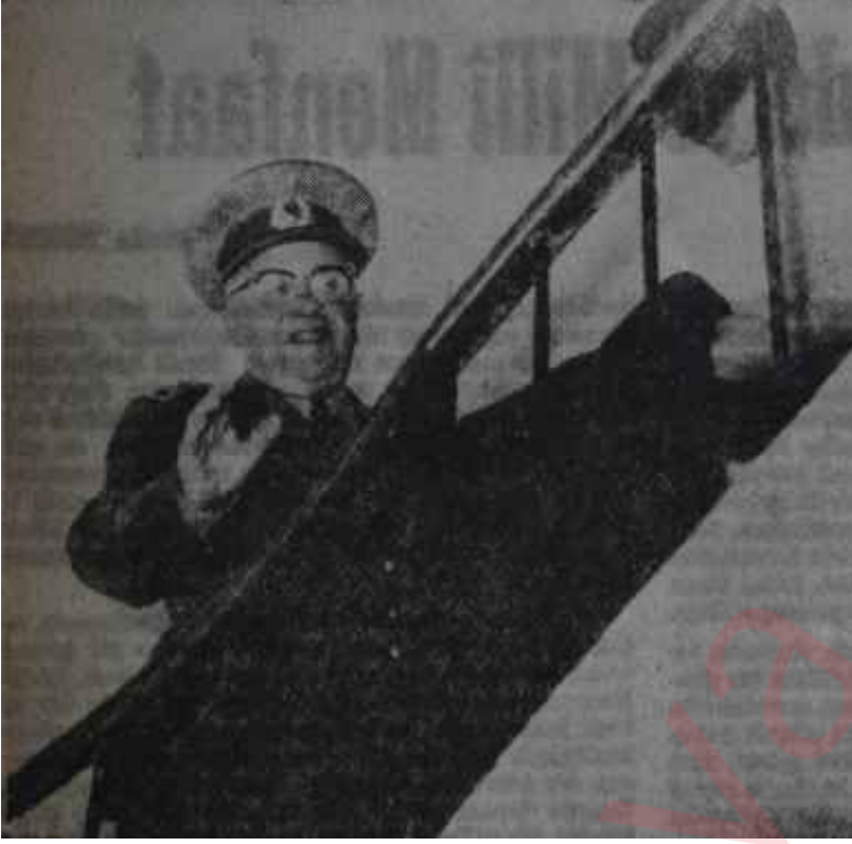
Orgeneral Sunay evinin merdivenlerinde Çankaya'ya doğru...

subunun, çoğunluk başka parti tarafından elde tutulan bir Parlâmentoda Cumhurbaşkanı seçilmesi pek tuhaf olacaktı. Böylece, zaten bir kenarından dokunulan İsmet İnönü ismi ortadan kalkınca Orgeneral Sunay, Türkiye Cumhuriyeti'nin hiç bir huzursuzluğa vesile verilmeksizin devredilebileceğinin delili sayılacak şekilde popülerite kazandı,