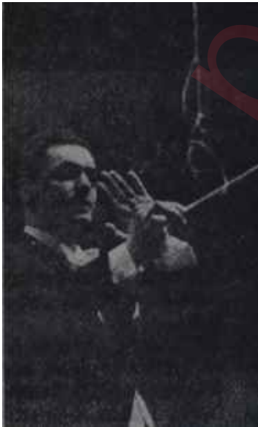
Hikmet Şimşek Sanata evet, haksızlığa hayır!

Bu ayın ilk günlerinde Bulgaristan, bir türk sanatçısını bekliyordu. Cumhurbaşkanlığı Senfoni Orkestrası İkinci Şefi Hikmet Şimşek, Türk Hükümetince kararlaştırılan programa göre, bu komşu ülkeye gidecek ve çeşitli konserler yönetecekti. Daha önce de Şimşek'in konserlerini dinlemiş olan bulgar müzikseverleri, düzenlenen ve asılan afişleri görmüşler ve bilet temini için teşebbüse geçmişlerdi. Şimşek 7 Şubat'ta Bulgaristanda olacaktı.