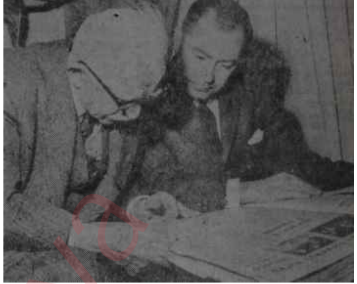
İsmet İnönü ve Metin Toker

HAFTALIK AKTÜALİTE DERGİSİ Kendi Aramızda