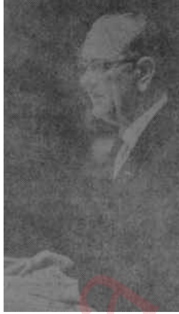
Lyndon Johnson Başında dert olunca...

Bütün bu olayların karşısında Başkan Johnson'un yaptığı, bir nevi oyalamacadan başka birşey değildir. Söylenilenlere bakılırsa, Johnson Alabama'ya federal kuvvetler yollamanın Güneyde şiddetli tepkiler yaratmasından korktuğu için tarafları güzellikle yola getirmek tarafıdır. Nite-