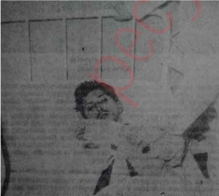
Yaralı bir işçi hastanede Boşuna akan kan

Son durum tam bir karışıklıktır. Hükümet başlangıçta benimsediği komünizm ithamını ispat edememektedir. Maden-İş Sendikası Hükümetle imzaladığı protokolün, yine Hükümet tarafından işçiye hoş görünmek için ihlâl üzerine fevran etmiş bulunmakta-