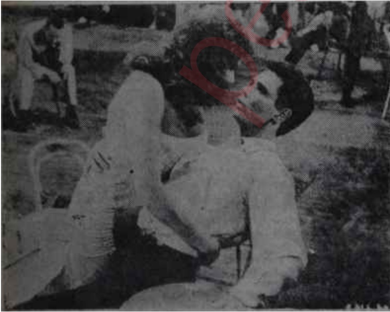
Beyaz perdede aşk Dışardan gelen özentî

Sinemacının sansürü "tamamak" cüreti nereden gelmektedir? Önce sansürün bugünkü Anayasa düzeni? aykırı oluşundan. Gerçi Anayasa Mahkemesi sansür tüzüğü'nün -daha doğrusu bu tüzüğe temel olan kanun maddelerinin- Anayasaya aykırı olmadığına karar vermiştir ama, bu kararın Anayasa Mahkemesinin "talihli" kararlarından olduğu söylenemez. Sansür tüzüğü herşeyden önce sağduyuda ve vicdanlarda mahkûm olmuştur ve bunun böyle olduğunu yine en iyi, sansürçüler bilmektedir. İkincisi, sansür heyetinin karar vermek yetkisi vardır, fakat bu karara aykırı davranışlara uygulanacak ceza müeyyideleri yoktur. Sansür üyeleri bu konuda ilgili makamlara ancak uyardıma bulunabilirler