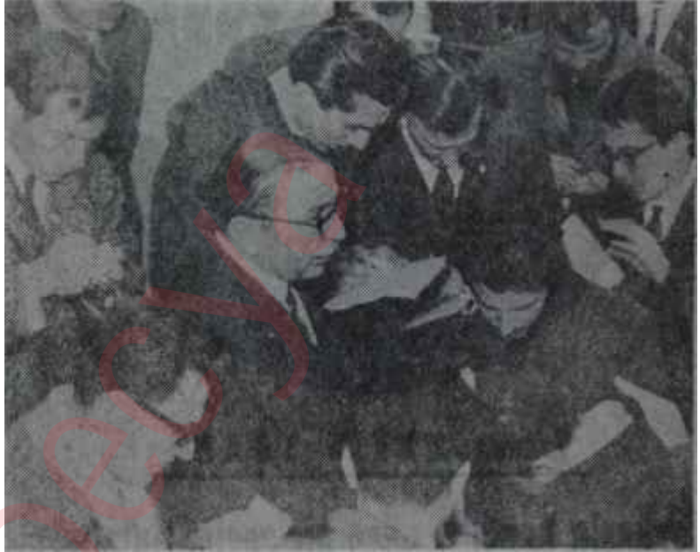
Çağlayangil, Zonguldak olayları hakkında açıklama yapıyor Esbab-ı mucibesine gelince

Çarşamba günü Siyasal Bilgiler Fakültesinin önünden hareket eden topluluğun davranışının yanlış anlamalara ve çeşitli yorumlara yol açabileceği söylenebilir. Daha şimdiden kulağa gelenler, bu yürüyüşün, demokratik dü-