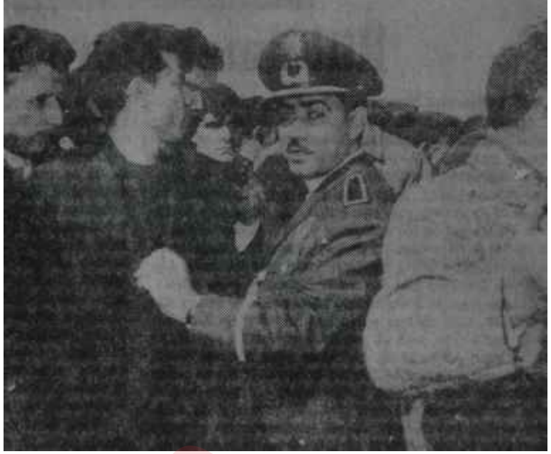
Zonguldak Emniyet Amiri halk arasında Tehlike çanları çoktan çalmıştı

Bu kelimeyi İhsan Sabri Çağ layangil Bakanlığının ayını dol durmadan bulup kullanmıştır- Tevekkeli adamcağızı Hükümet Sözcüsü yapmamışlar!' Sözcü dediğin de diline çubuk olmalıdır. Değil mi, efendim?