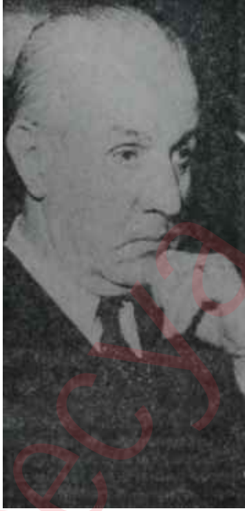
Suat Hayri Ürgüplü

Koalisyon partileri, liderlerinden müteşekkil, yani Bakanların üstünde bir süper komite kurmuşlardır. Bir çok meselenin bu komitede görüşülmesini kararlaştırmışlardır. Şüphe yok ki Bakanlar bu süper komiteye dahil olan liderlerinin etkisini daima üzerlerinde hissedeceklerdir. Eğer liderlerin tamamı Hükümet üyesi bulunsaydı kuruluşun garipsenecek tarafı olmazdı. Ama sayın büyüklerin üç tanesi, hem de Ahmet Oğuz istisna edilirse en konuşkanları Kabinenin dışındadırlar. O itibarla tamami sorumsuz bir mevki işgal etmektedirler. Bunların bir nevi denetleme ve direktif verme görevi yapmaları hemen herkes tarafından Anayasaya aykırı bulunmuştur.