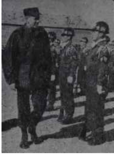
General Taylor Rest

Ufukta görünen başkan adaylığını bir tarafa iterek Saygonda görevde devam etmek, hiç şüphesiz, Lodge'in ülkesine bağlılığını göstermektedir. Fakat bu bağlılık, şimdi öyle anlaşılıyor ki, Goldwater'den başkasının işi ne yararmış değildir. Zaten, işin aslına bakılırsa, Goldwater'in Cumhuriyetçi Parti içinde en kuvvetli başkan adaylığına kadar yükselmesi, ancak Lodge de dahil, bütün Cumhuriyetçi liderlerin bir dizi yanlış davranışları sonunda mümkün olabilmiştir. Önce, bütün Cumhuriyetçilerin sevip saydıkları eski Başkan Eisenhower genç ve değerli bir aday seçip onu ileri sürmekte çok gecikmiş, sonra, bu da yetişmiş gibi, uzun bir süre Goldwater'a karşı durum almakta te-