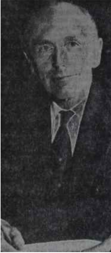
Sir Alec Douglas Home Anlayışlı dostlar

vazgeçmesini istiyordu. Tabii Türkiye de kendi iç yetkisine giren ve güvenilir düşüncesiyle yapılan bu işe Yunanistanın baskısıyla son verecek, değildi.