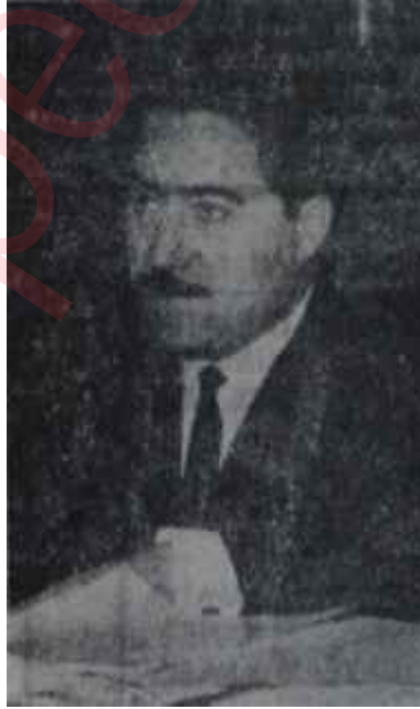
Turun Şahin Peki ya hiç vermeyen!

Bu konuda hangi görüşün doğru olduğu daha belli olmamakla beraber, Köy İçme Sularının Köy İşleri Bakanlığına bağlanması konusunda Devlet Plânlama Dairesiyle Enerji Bakanlığının görüşlerinin karşısında, İstanbul Üniversitesi İdari İlimler Enstitüsü raporu yer almaktadır. Bu rapor