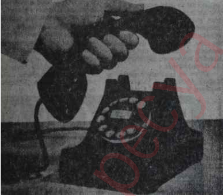
Telefon cihazı Televizyonlusuna doğru

Geçen haftanın ortasında dünya radyoları ve basını, Amerikanın yeni bir buluşu daha uygulama alanına koyduğunu ilân etti. Bu, uzun yıllardanberi hayâl edilen, ama bir türlü pratik bir çözüm tarzı bulunamadığından ve ekonomik sınırlar içersine sokulmasına imkân olmadığından gerçekleştirilemeyen bir buluştu. Yoksa ilim ve hele tekniğin bu kadar ileri gittiği bir çağda böyle basit sayılacak bir sistemi işler duruma getirmek pek de güç bir iş değildir.