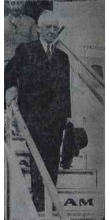
İnönü ve eşi Elele

Bütün bunlara ek olarak, Adada Yunanistanın da bütün milletlerarası andlaşmalara aykırı bazı çalışmalar yaptığı yolunda haberler alınıyor. Örneğin, Adaya kaçak olarak sokulan yunan silâhlarının sayısı bir hayli kâbardığı gibi, Yunanistan son bir ay içinde Kıbrıstaki 950 kişilik birliğinin mevcudunu bir tûmene kadar çıkarmıştır. Bütün bu olup bitenlerin nasıl olup da Birleşmiş Milletler sorumlularının gözünden kaçtığı, merak verici bir bilmedir.