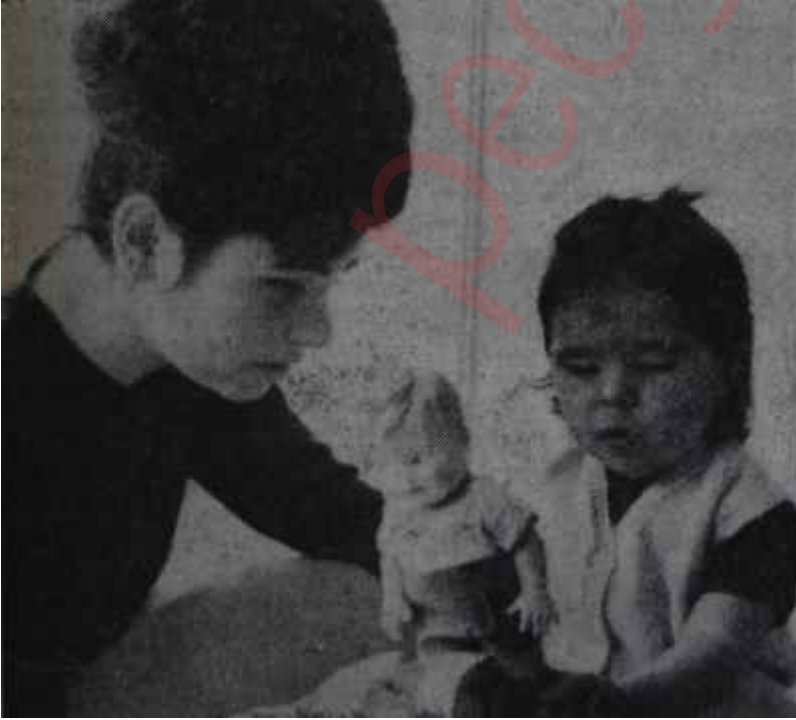
Anne ve çocuk Anlayış, sabır, bilgi