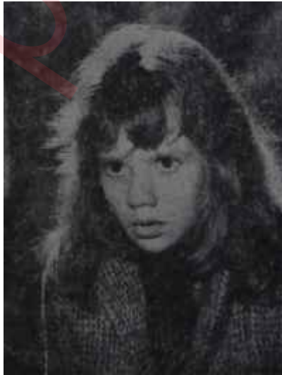
Hayley Mills Muhafazakar

Forbes, filminde önce mekânı, sonra da hikâyesinin kahramanlarını-