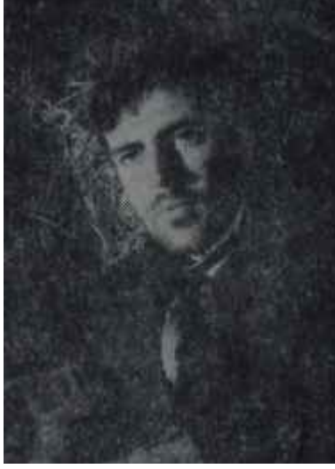
Alan Bates Sözde İsa!

Önce dine karşı bir filmidir; yani din dışıdır ve günümüz gerçekleriyle dinin gerçek ötesi yanlarını çatıştırılmaktadır. İngiltere gibi muhafazakâr bir ülke sansürünün bu çeşitten bir filme "vize" vermesi bakımından da ayrı bir önem taşımaktadır.