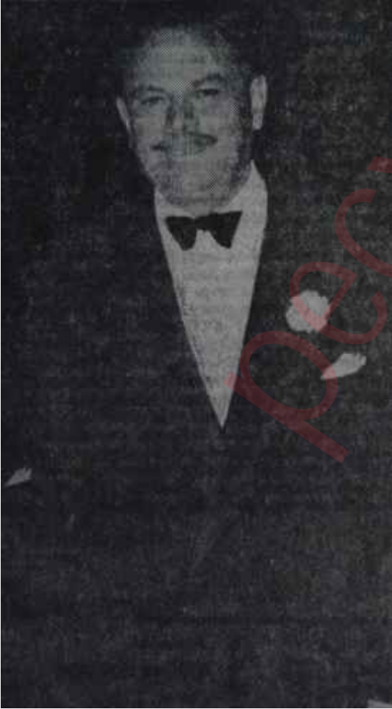
Eyüp Han Candan bir dost

Ziyaretler — Pakistan Başbakanı Eyüp Han, 3 Temmuz Cuma günü Türkiye'ye gelecek ve Cumhurbaşkanı Cemal Gürsel ve Başbakan İsmet İnönü ile görüştüktan sonra İngiltere'ye gidecektir.