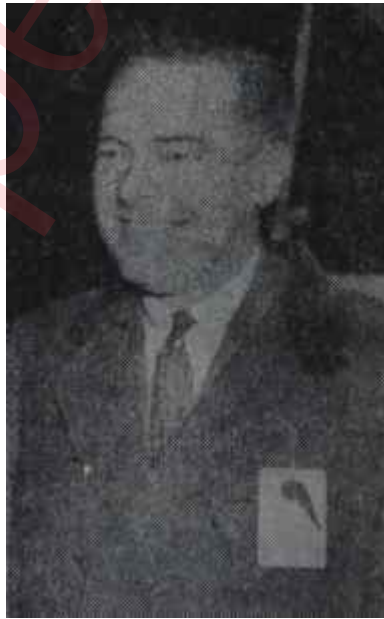
Henry Cabot Lodge Kampanyayı açtı

reddüt geçirmiştir. İkinci olarak partinin genç ümitleri de, uzun bir süre, yarışa katılma konusunda kararsız görünmüşlerdir. Bugün bütün aklı başın da Cumhuriyetçilerin desteklediği Scranton, Goldwater'in karşısına" dikilmeye ancak son dakikada karar verebilmiştir. Genç ümitlerin içinde Goldwater'e karşı en kahramanca di-