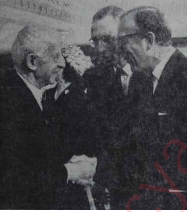
İnönü hava alanında Lord Carrington ile birlikte Görüşmek için

ler ve anlayışla karşılamışlardı. Nitekim İnönü de, Londraya gitmek üzere New York'tan ayrılırken bu nokta üzerinde önemle durdu ve gazetecilere, Kıbrıs anlaşmazlığına bir çözüm yolu bulunmadıysa bile, türk-amerikan dostluğunun bulutlardan sıyrıldığını söyledi. Anlaşılan, Türkiye Başbakanı, Amerikanın Kıbrıs konusundaki millet lerarası anlaşmaları bağlayıcı saymağa devam etmesini bu dostluğu kurtarmaya yetecek kadar önemli bir adım olarak karşılıyordu.