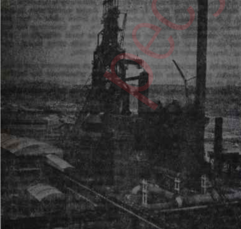
Ereğlide yüksek firm

Ancak bütün bunlar, geri kalmış, geriliğe alışmış bir memleketin, hızlı gelişmeye ayak uydurmakta çekeceği ilk şaşkınlıklardan başka bir anlam taşımamaktadır.