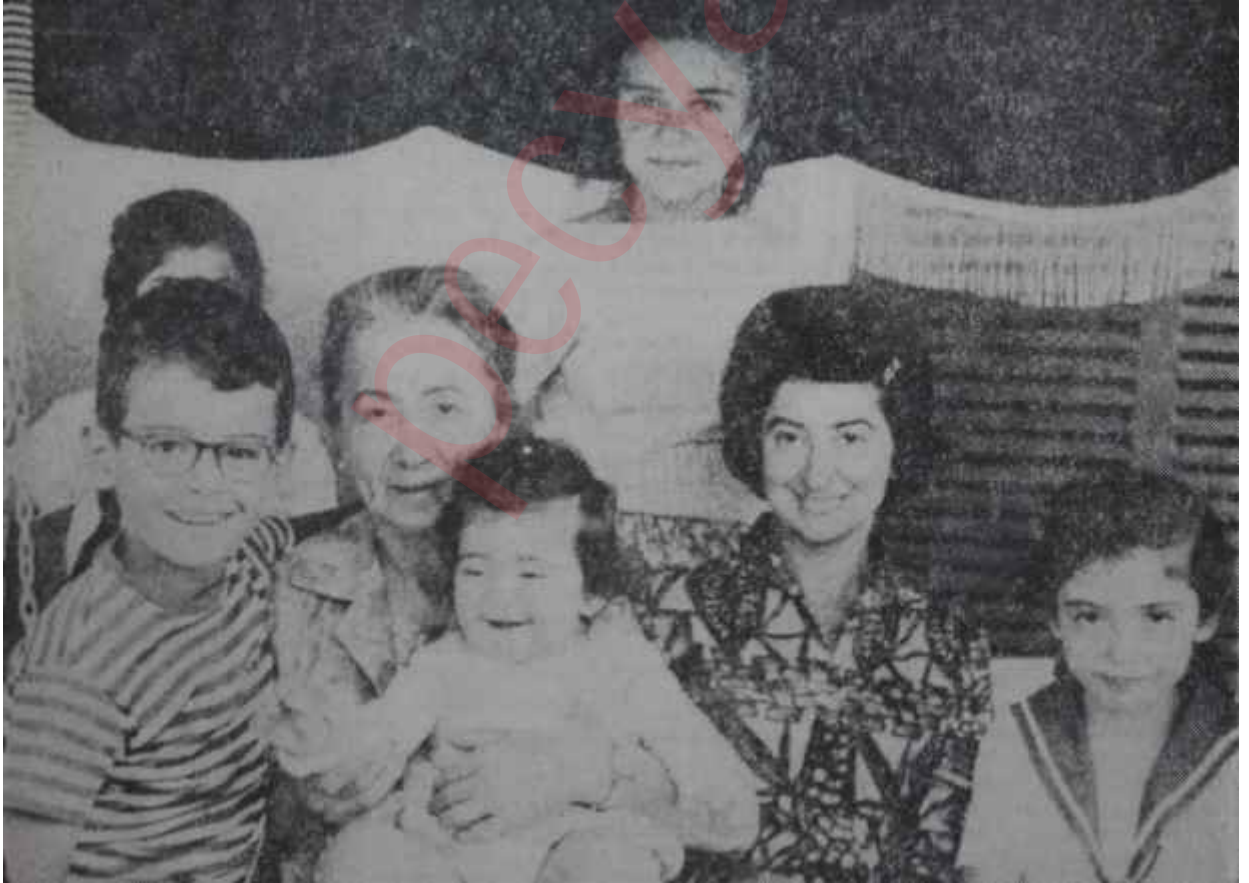
Mevhibe İnönü torunlarıyla beraber

Amerika garip bir memleket... Modern hayatın bütün aşırı cereyanları-