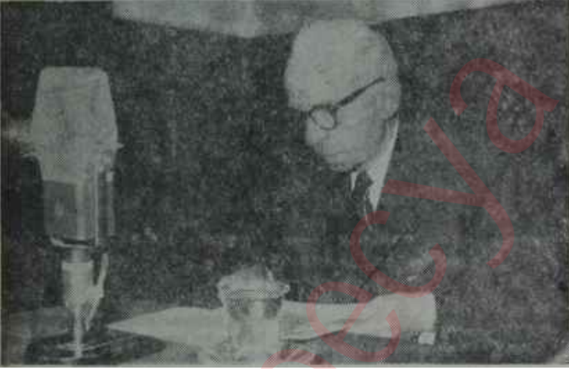
Başbakan İnönü radyoda konuşuyor

Her şey bundan bir kaç gün evvel değil, bir kaç hafta evvel de değil, bir kaç ay evvel, A. P. Genel Başkanını Ragıp Gümüşpala'nın bir takım manevralara giriştiğinin A. P. içinde ayan beyan belli olmasıyla başladı. Bir gerçek şudur: Koalisyonun kuruluşu sırasında, A. P. nin itidal sahipleri Genel Başkanı kendi saflarına al-