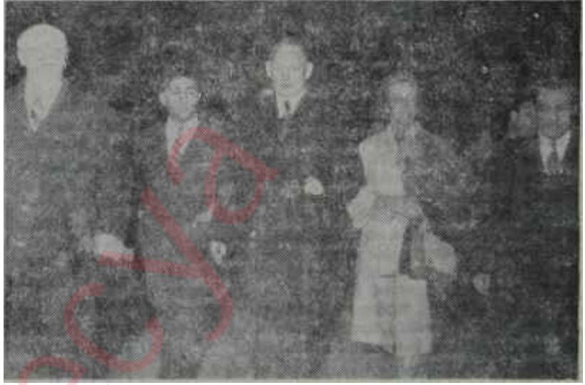
Dirk Stikker Yeşilköy hava alanında karşılanıyor İyi haber getiren misafir