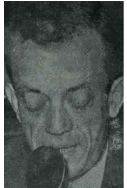
Apaydın kardeşler Bir bardak suda fırtına