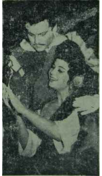
"Don Juan" Kıltık oldu