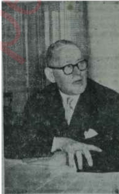
Stikker konuşuyor Tatlı yemeli, tatlı konuşmalı

Genel Sekreterin bu açıklamaları, son günlerde Ankaraya gelen haberleri teyit etti. Öğrenildiğine göre, "Edgar Faure Heyeti" diye bilinen heyet, NATO Bakanlar Kuruluna Türkiye hakkında son derece müsbet ve güzel bir rapor vermiştir. Bu raporda, Türkiye'nin kalkınma gayretleri incelenip tutumumuz takdir edilmek-