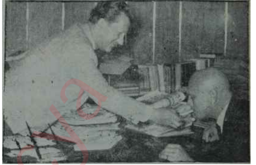
Basın Yayın ve Turizm Bakanı sigara yakıyor

Topkırı bugün gibi o gün de ortada ne bir senaryo, ne para, ne teşebbüse hevesli ciddi şirket, ne de verilmiş karar vardı. Sadece bir adam, bir başka adamı "İşte, filmde Atatürkü bu oynayacak!" diye yakalayıp getirmişti. Bu, o muameleyi