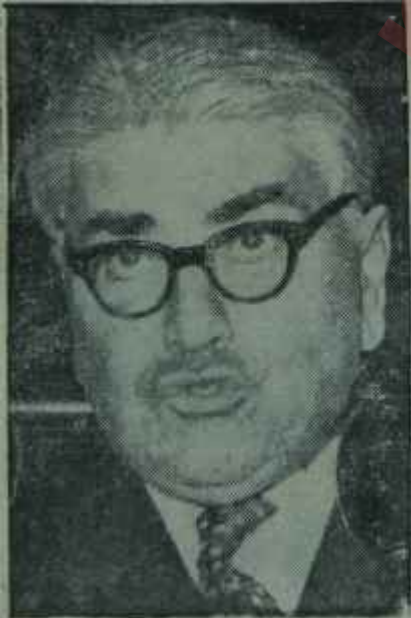
Süreyya Endik "Eyvallah!"

Hareket, haftanın başında, A. P. den ayrılmış olan Süreyya Endikin bir basın toplantısında hedefleri açıklamasıyla önem kazandı. O gün günlerden salı, saat 14.30'du. Süreyya Endik A. P. den -bu sefer- ciddi olarak istifa ediyordu. Meclisin Basın Bürosuna kararlı adımlarla girdi ve uzun masanın başına oturdu. Önüne, Meclis üyelerinin kullandıkları bir kâğıda arkalı önlü eski türkçe harfleriyle yazılmış demecini koydu. Kam çerçeveli gözlüğünü, burnuna oturtuktan sonra söze başladı. İstifasının sebeplerini açıklıyordu.