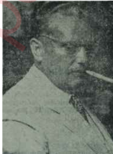
Mareşal Tito Şantaj mı ?

"Stalin ile Konuşmalar" ında yazar o tarihlerde komünist dünyasının bütün meratip silsilesini teferruatle anlattıktan sonra, bilhassa Stalinin şahsiyeti, yaşayışı üzerinde durmaktadır. Stalin çalışırken, kumanda ederken, Almanlara karşı harbi yönetirken görülüyor. Zajim, kan döküçl, kurnaz ve içine kapanık bir adam.. A-