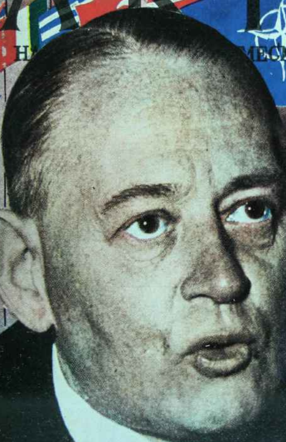
Dirk U. STIKKER Nato Genel Sekreteri