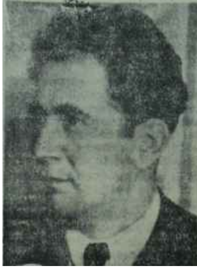
Milovan Cilas İfşa ediyorum!

Amerikada basılmakta olan kitabın provalarından mahdut bir basın kesimine intikal eden pasajlardan şu anlaşılacaktır: Milovan Cilas, 1944, 1945 ve Yugoslavyanın komünist âleminden aforoz edildiği 1948 tarihlerinde Stalin ile müteaddit defa görüşmüş ve korkunç diktatörün sofrasohbetlerinde hazır bulunmuştur. Bu konuşmalardan kalan hatıralarım Milo Van Clas, 961 ocak ayında serbest bırakılmasından sonra kaleme almıştır. Kitap ancak bir yıl içinde hazır olmuş ve aynı yılın Aralık ayında Amerikaya uçurulmuştur. "Stalin ile Ko-