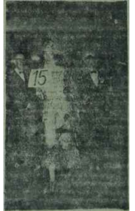
Fransız Horozu Şampiyon

Gecenin ikinci hususiyeti, Ankaranın bütün güzel hanımlarının salonlarda gayriresmi bir cazibe, zerafet ve sıklık müsabakasının unsurlarını teşkil etmeleri oldu. Kim daha güzeldi, kim daha cazip, zarif ve şıktı bir karara varılamadı. Doğrusu istenilirse, buna imkân da yoktu. Zira bir şehrin en güzel bütün hanımları bir ba-