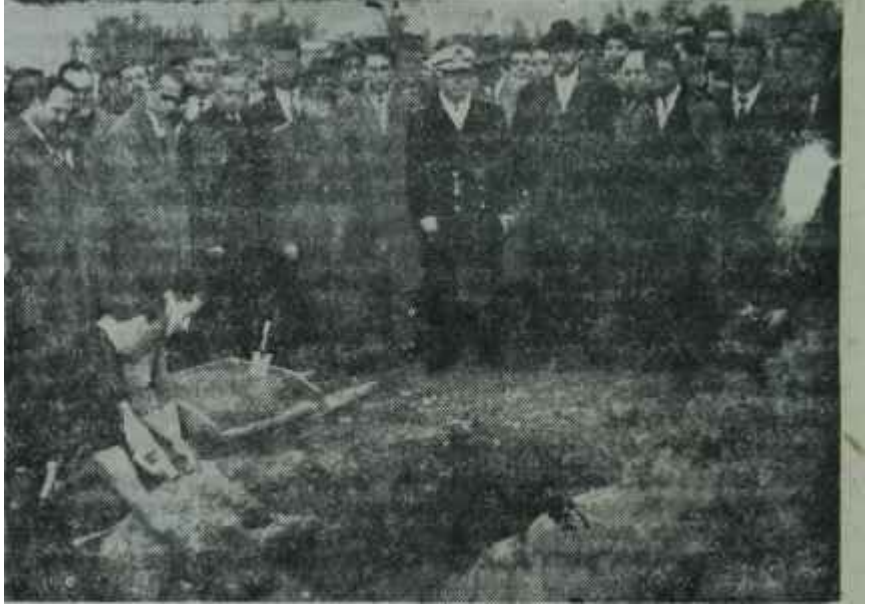
Good - Year lâstik fabrikasının temeli atılıyor Gerisi kolay!

Özel teşebbüsün bilhassa İstikrarlı ve kuvvetli bir hükümet kurulduktan sonra cesareti arttı ve yatırım yapma politikası gelişti. 1960 ve 1961 yılları gerçi Özel teşebbüs için oldukça verimsiz geçmiştir ama, çeşitli siyasi faktörler, piyasada dolaşan dedikodular 1962 nin de tereddüt yılı olduğu zehabını uyandırdı. Bazı teşebbüs sahipleri ciddi endişe izhar ettiler. 1960 yılında teşebbüs edilen büyük bir yatırım hamlesi, bu dedikoduların bir nebze önüne, geçti. Amerikanın meşhur sanayi teşekküllerinden Good Year ve U, S. Royal firmaları 1962 yılının hemen başlarında, kura-