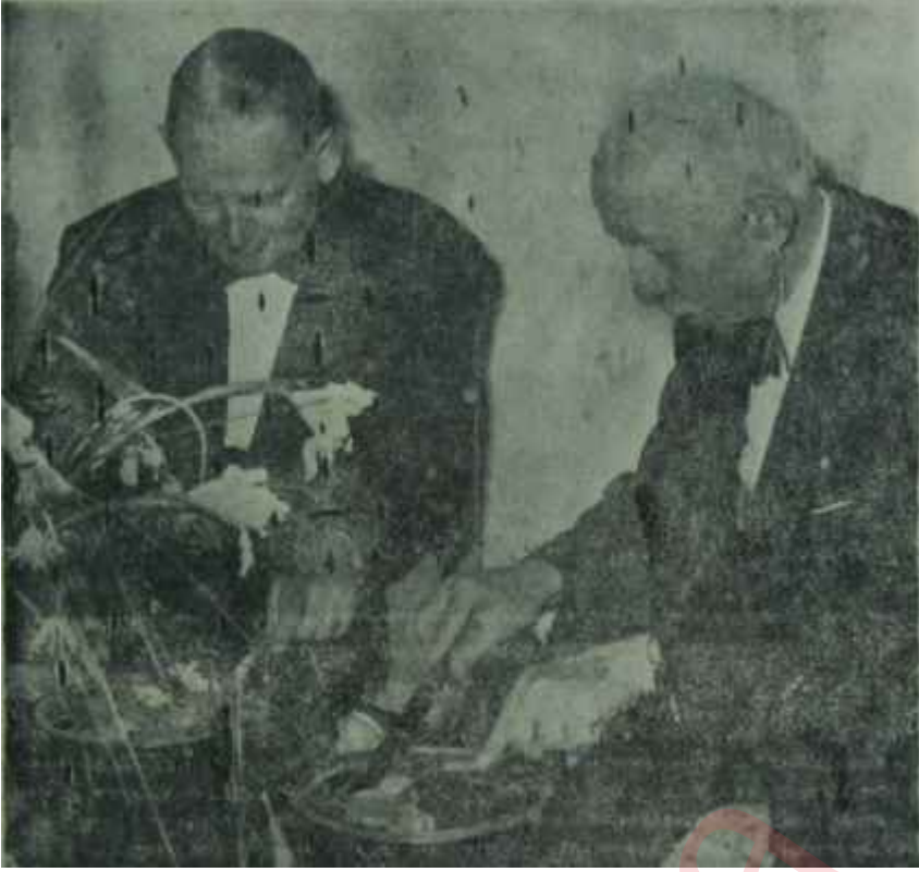
Stikker Hariciye Köşkünde İnönü ile Başbaşa Cancığoldular