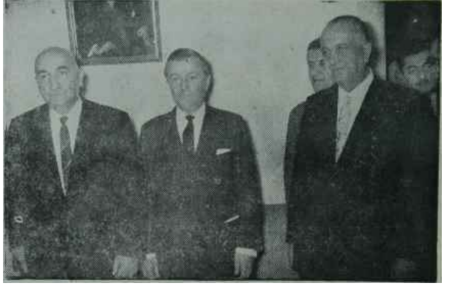
Cumhurbaşkanı Gürsel C. H. P. idarecileriyle

Devlet Başkanı, konuya dekor olarak siyasi parti merkezlerinin ka-